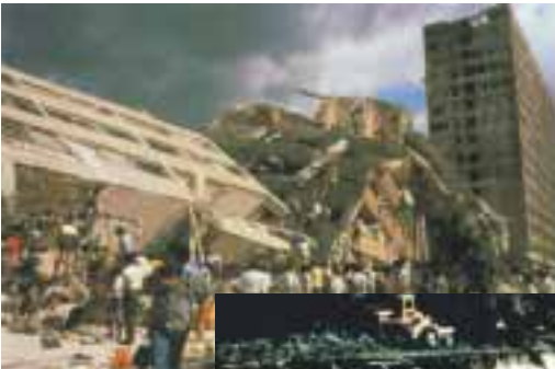
Mexico City şiddetli bir depremle yerle bir oldu.

Son birkaç yıl içinde meydana gelen büyük ve sürekli depremler, dünya kamuoyunun gündeminde devamlı olarak ilk sıralarda yer almaktadır. Amerikan Ulusal Deprem Enformasyon Merkezi verilerine bakılırsa 1999 yılında, yeryüzünde 20.832 deprem meydana gelmiştir. 3