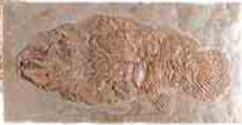
Günümüz çamur balığı

Dönem: Senozoik zaman, Eosen dönemi Yaş: 54 - 37 milyon yıl Bölge: Messel Shales Oluşumu, Almanya